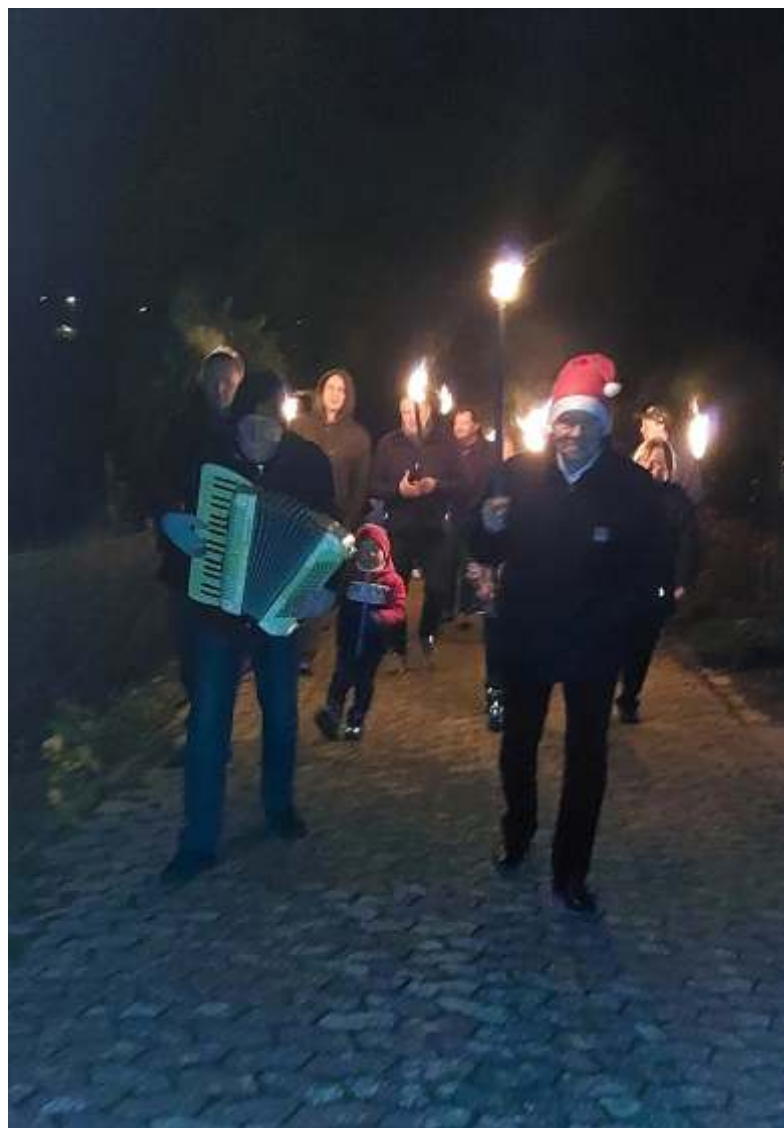
Fackelzug in der Anlage am 3. Dezember 2022